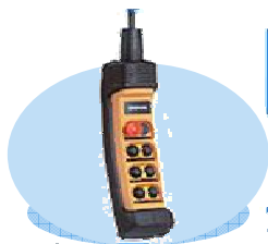
Catégorie 1 Pendentif