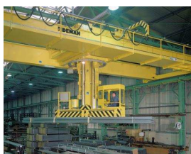
Catégorie 3 Cabine